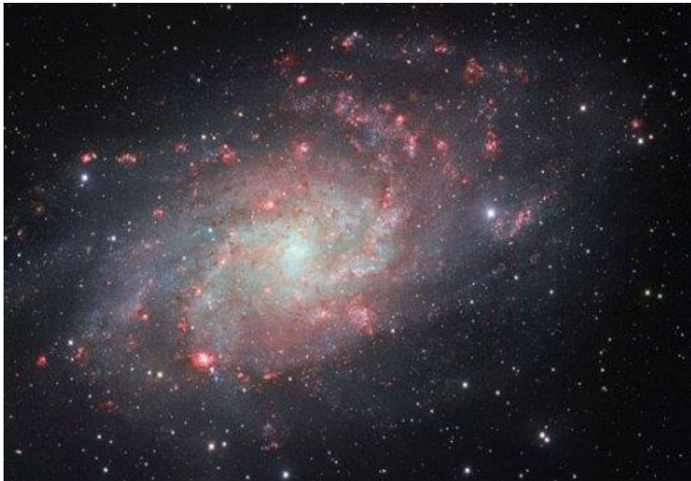
Image de la galaxie Messier 33 obtenue en août 2014 au VLT de l'ESO.

Dans un article publié en juillet 2014 dans la revue Monthly Notices of the Royal Astronomical Society , des scientifiques de l'Observatoire de Paris, de l'université Pierre et Marie Curie et de l'INAF-SISSA de Trieste (Italie), s'attachent à décrire les principales propriétés observées dans les galaxies à l'aide d'une nouvelle théorie où interviennent matière noire et gravité.